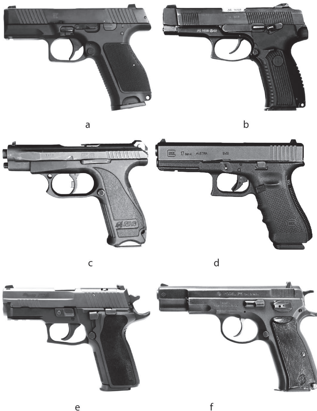
Рис. 1. 9-мм pistols: ПЛК (a), ПЯ (b), ГШ-18 (c), Glock 17 (d), SIG Sauer P229 (e), CZ 75 (f) Fig. 1. 9mm pistols: PLK (a), PY (b), GSh-18 (c), Glock 17 (d), SIG Sauer P229 (e), CZ 75 (f)

Изучение материальной части pistols, технической документации на них, а также литературных источников [1; 4–7; 10, с. 16–24] указывает на сходство их конструкции и ряда важных тактико-технических характеристик. Это касается кали-