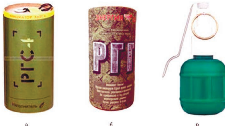
Рис. 4. Сертифицированные пиротехнические изделия для страйкбола, наполненные горохом (разрывной заряд – петарда «Корсар-4»): а – граната учебная страйкбольная РГС-4; б – граната учебная страйкбольная РГГ; в – граната учебная страйкбольная ГСП-Г (практическая) Fig. 4. Certified pea filled airsoft pyrotechnic devices (burst charge – «Korsar-4» firecracker): a – dummy airsoft hand grenade RGS-4; б – dummy airsoft hand grenade RGG; в – dummy airsoft hand grenade GSP-G (practice grenade)

ные гранаты классифицируются как имитационные пиротехнические изделия, взрывными устройствами не являются.