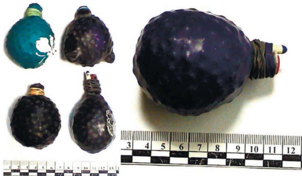
Рис. 2. Общий вид самодельных устройств сферической формы Fig. 2. General view of spherical improvised devices

менами гороха массой около 50 г (масса одной горошины ~0,15 г, диаметр ~6 мм).